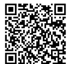
Manuscrit 01 (AFF)